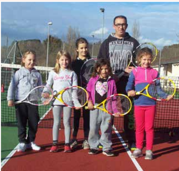
Groupe 1 - École de Tennis