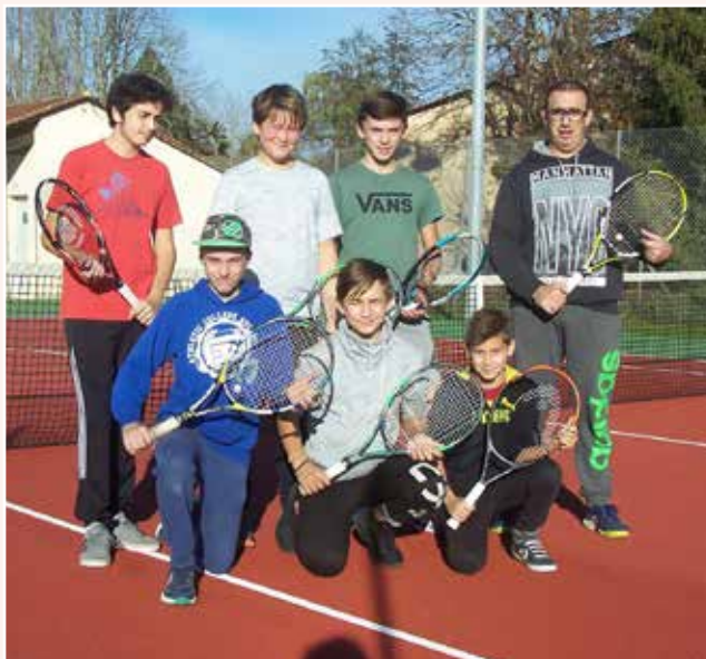
Groupe 2 - École de Tennis