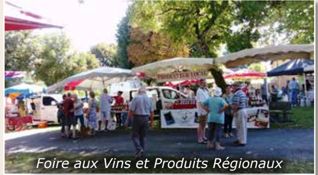
Foire aux Vins et Produits Régionaux

Nous tenons à remercier les exposants toujours au rendez-vous ainsi que l'ensemble des bénévoles de l'Animation Sioracoise et de Siorac Initiative pour la restauration et la buvette mais aussi du Club Œnologique pour l'animation de cette journée.