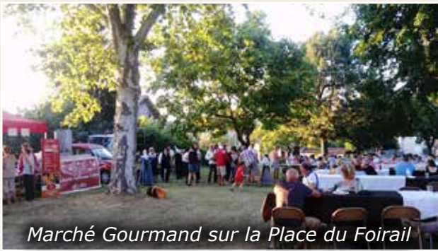
Marché Gourmand sur la Place du Foirail

Après le succès de l'année dernière, le Marché Gourmand de Juillet a été reconduit, le lundi 23 Juillet ainsi qu'une date supplémentaire le jeudi 16 Août.